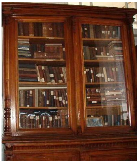
Рис. 3. Книги из библиотеки общества.

«составление правил библиотеки дело крайне трудное: с одной стороны, если представить такую возможность, пользоваться книгами, чтобы каждый брал, сколько ему нужно, и держал их также, сколько ему желательно, то будет библиотеке грозить большая утрата многих книг..., с другой стороны, строгие правила и кары уменьшать размеры пользования библиотекой действуют в ущерб прямой высокой задаче библиотеки... Таким образом, весь секрет правильной и успешной деятельности библиотеки заключается в благородстве и аккуратности по отношению к библиотеке тех, кто пользуется ею». Эти слова не потеряли своей актуальности и в наши дни. В октябре 1895 года общество праздновало 25-летие своей деятельности. К этому моменту по документальному каталогу в библиотеке числилось 5418 названий, 7500 экз. изданий, в том числе 1758 экз. на иностранных языках. По богатству фонда библиотека общества врачей г. Казани являлась одной из первых среди библиотек медицинских обществ России (для сравнения — библиотека общества Киевских врачей за 50 лет существования имела 1700 экз. изданий, библиотека Харьковского медицинского общества за 33 года — 2062 издания). Помимо периодических изданий, протоколов и трудов медицинских обществ библиотека располагала богатой коллекцией диссертаций в количестве 2554 экз., из них Казанскому университету принад-