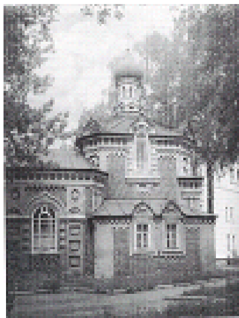
Рис. 4. Здание Варсофьевской церкви.

«составление правил библиотеки дело крайне трудное: с одной стороны, если представить такую возможность, пользоваться книгами, чтобы каждый брал, сколько ему нужно, и держал их также, сколько ему желательно, то будет библиотеке грозить большая утрата многих книг..., с другой стороны, строгие правила и кары уменьшать размеры пользования библиотекой действуют в ущерб прямой высокой задаче библиотеки... Таким образом, весь секрет правильной и успешной деятельности библиотеки заключается в благородстве и аккуратности по отношению к библиотеке тех, кто пользуется ею». Эти слова не потеряли своей актуальности и в наши дни. В октябре 1895 года общество праздновало 25-летие своей деятельности. К этому моменту по документальному каталогу в библиотеке числилось 5418 названий, 7500 экз. изданий, в том числе 1758 экз. на иностранных языках. По богатству фонда библиотека общества врачей г. Казани являлась одной из первых среди библиотек медицинских обществ России (для сравнения — библиотека общества Киевских врачей за 50 лет существования имела 1700 экз. изданий, библиотека Харьковского медицинского общества за 33 года — 2062 издания). Помимо периодических изданий, протоколов и трудов медицинских обществ библиотека располагала богатой коллекцией диссертаций в количестве 2554 экз., из них Казанскому университету принад-